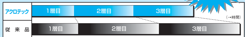
■アクロテックと従来品との乾燥性比較

※乾燥性は、作業条件(温度・湿度)などによって左右されます。※横軸は時間の経過を表しています。