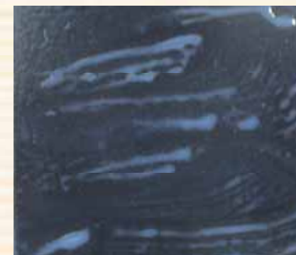
はじいている(他社品)