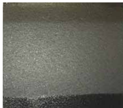
洗浄後(プロX) (完全にはく離している)