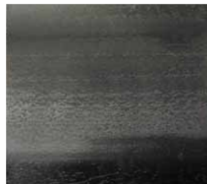
洗浄後(他社品) (はく離残しがある)

※ポリウレタン配合樹脂仕上剤を10層塗布して十分に養生した後、ウォッシュビリティータスターを使用してはく離状態を確認した。