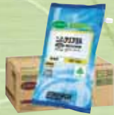
ジムクリスタル エコパック