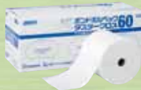
ポルベック ダスタークロス60